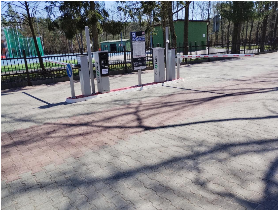
Foto 5: szlaban wjazdowy i wyjazdowy do oznakowania linią zatrzymania i zatrzymania warunkowego