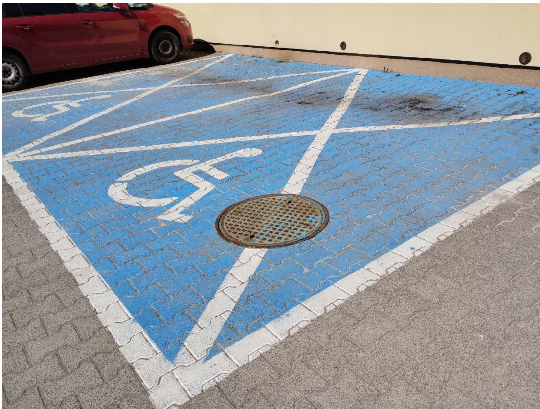
Foto 6: stanowiska parkingowe dla osób niepełnosprawnych- odnowienie oznakowania.